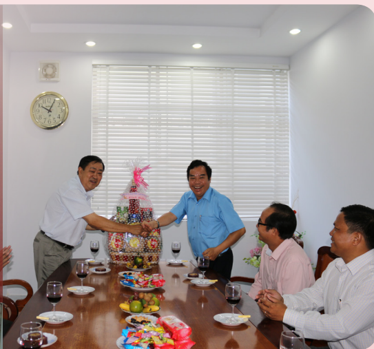
Trường Đại học Kiên Giang.