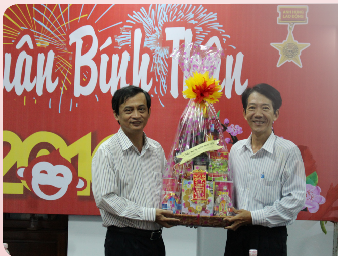
Trường Đại học Kỹ thuật Công nghệ Cần Thơ.