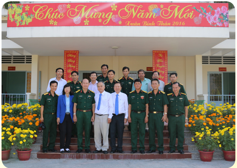
Thăm và chúc tết cán bộ, chiến sĩ Trung đoàn 1 - Sư đoàn 330.

sâu sắc, lời động viên ân cần của Trường ĐHCT dành cho cán bộ, chiến sĩ. Trong năm qua, mặc dù điều kiện các đơn vị hết sức khó khăn nhưng bằng sự nỗ lực, phấn đấu khắc phục mọi trở ngại của tất cả cán bộ, chiến sĩ và đặc biệt là sự quan tâm, động viên, hỗ trợ từ phía Trường ĐHCT nói riêng và hậu phương nói chung, các đơn vị nơi tiền tuyến đều đạt được những thành tích đáng khích lệ. Trong niềm hân hoan đón chào một năm mới sắp đến, thay mặt toàn thể cán bộ chiến sĩ, lãnh đạo các đơn vị trân trọng ghi nhận những tình cảm của hậu phương nói chung và Trường ĐHCT nói riêng dành cho các đơn vị, đó sẽ là động lực mạnh mẽ để các chiến sĩ giữ