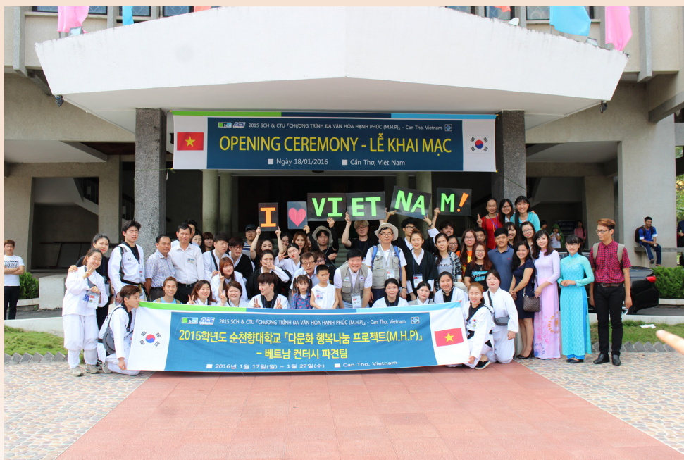
Ảnh lưu niệm của các tình nguyện viên tại lễ khai mạc.

Ngày 18/01/2016, tại Hội trường Lớn-Trường Đại học Cần Thơ (ĐHCT) đã diễn ra Lễ Khai mạc “Hoạt động tình nguyện của Trường Đại học Soon Chun Hyang” năm 2016. Tham dự buổi lễ có đại diện lãnh đạo thành phố Cần Thơ; Liên hiệp Các tổ chức Hữu nghị thành phố Cần Thơ; Trường Nuôi dạy Trẻ Khuyết tật thành phố Cần Thơ; Trường Khuyết Tật Tương Lai; Trường Đại học Soon Chun Hyang, Hàn Quốc; Trường ĐHTC; và đặc biệt là 26 tình nguyện viên đến từ Trường Đại học Soon Chun Hyang và đông đảo sinh viên Trường ĐHTC cùng tham dự.