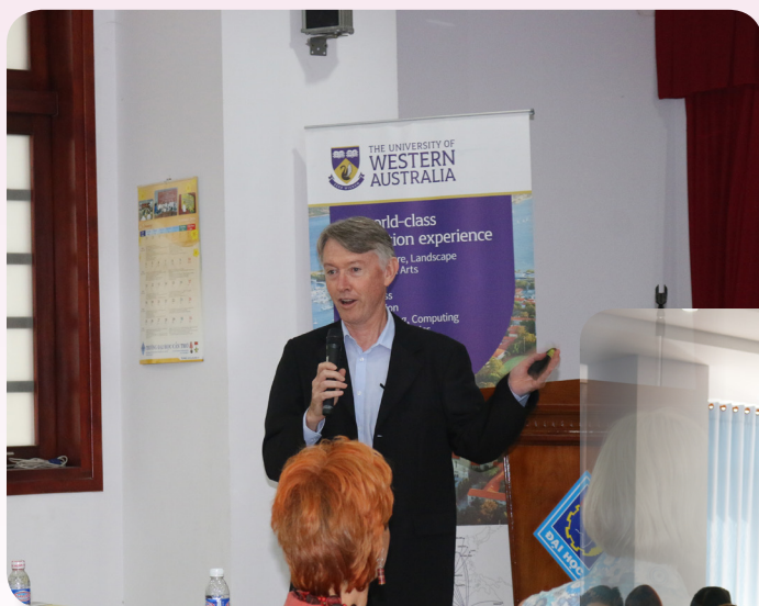
Chuyên gia Trường ĐH Western Australia giao lưu với cán bộ, giảng viên và sinh viên của Trường.

Ngoài ra, đoàn công tác của Trường Đại học Western Australia đã có buổi gặp gỡ, giao lưu với cán bộ, giảng viên và sinh viên Trường ĐHTT. Là trường đại học nghiên cứu chuyên sâu, được xếp thứ nhất ở Úc và thứ 25 trên thế giới về lĩnh vực Khoa học đời sống và Nông nghiệp, các chuyên gia của Western đã có buổi báo cáo các nội dung liên quan Phát triển nông thôn và Quốc tế, một lĩnh vực quan trọng đối với nước nông nghiệp như Việt Nam, đồng thời, giới thiệu các chương trình học bổng thạc sĩ và tiến sĩ.