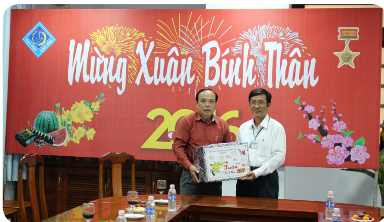
Tỉnh ủy, HĐND, UBND, UBMTTQ tỉnh Kiên Giang.

khoa học và chuyển giao công nghệ cho vùng. Với sự nỗ lực của tập thể thầy và trò, Trường ĐHCT đã có những đóng góp quan trọng cho sự phát triển của thành phố Cần Thơ nói riêng và của vùng ĐBSCL nói chung. Các đơn vị cũng không quên gửi lời cảm ơn chân thành đến sự hợp tác, hỗ trợ hết sức nhiệt tình từ Ban lãnh đạo và cán bộ Nhà trường trong thời gian qua.