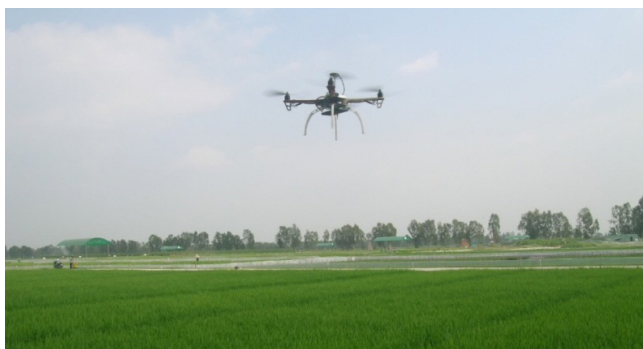
Máy bay tự hành theo GPS phục vụ lĩnh vực nông nghiệp