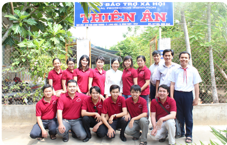
Trung tâm Liên kết Đào-Tạo Đại học Cần Thơ thăm trẻ em mồ côi tại cơ sở bảo trợ xã hội Thiên Ân.

Đây là hoạt động xã hội có ý nghĩa thể hiện sự quan tâm, chia sẻ với cộng đồng, với những hoàn cảnh khó khăn, bất hạnh trong xã hội. Bên cạnh đó, chính những nụ cười rạng rỡ của các em đã giúp cho các thành viên trong chuyến đi có thêm động lực để làm việc và cống hiến cho cuộc sống.