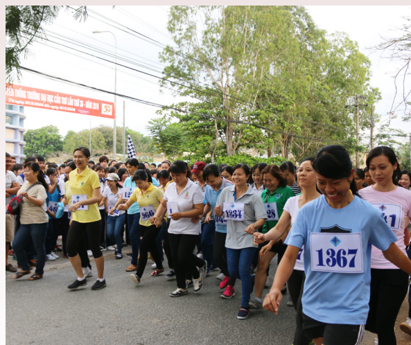
Môn chạy việt dã nữ.

2.600 VĐV đến từ 18 đoàn thể thao thuộc các khoa, viện, trung tâm, bộ môn trực thuộc Trường. Giải đi bộ thể thao và chạy việt dã đã nhận được sự hưởng ứng nhiệt tình của hơn 600 VĐV, mở màn cho một kỳ Hội thao sôi động và nhiều thành tích.