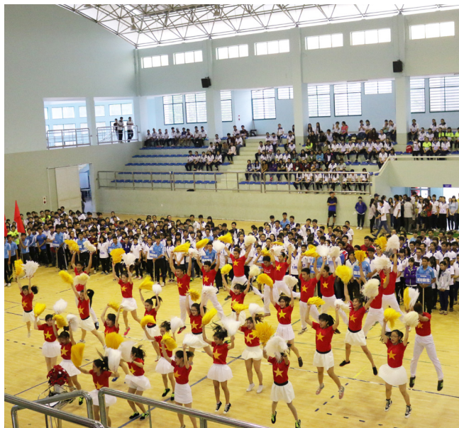
Lễ Khai mạc Hội thao Truyền thống Trường ĐHCT lần thứ 36 năm 2016 tại Nhà Thi đấu Thể dục thể thao.