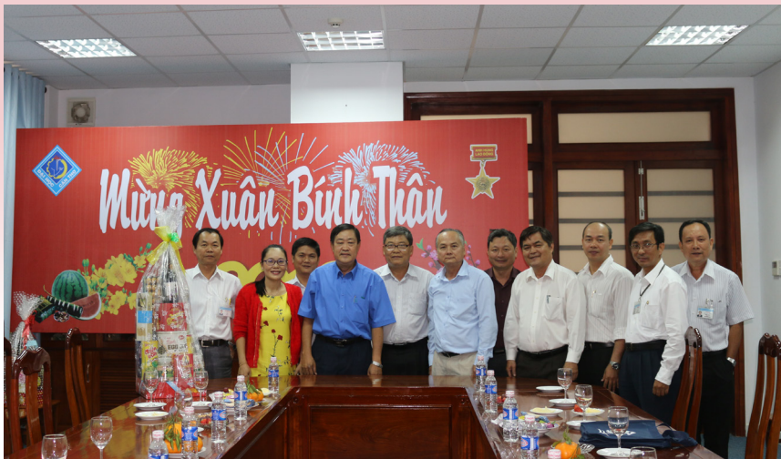
Trường Đại học Bách khoa thành phố Hồ Chí Minh đến thăm và chúc tết Trường.

T rong những ngày đầu trước thềm năm mới, từ ngày 21/01/2016 đến ngày 04/02/2016, Trường Đại học Cần Thơ (ĐHCT) hân hoan đón nhận những tình cảm nồng hậu cùng những lời chúc xuân tốt đẹp từ