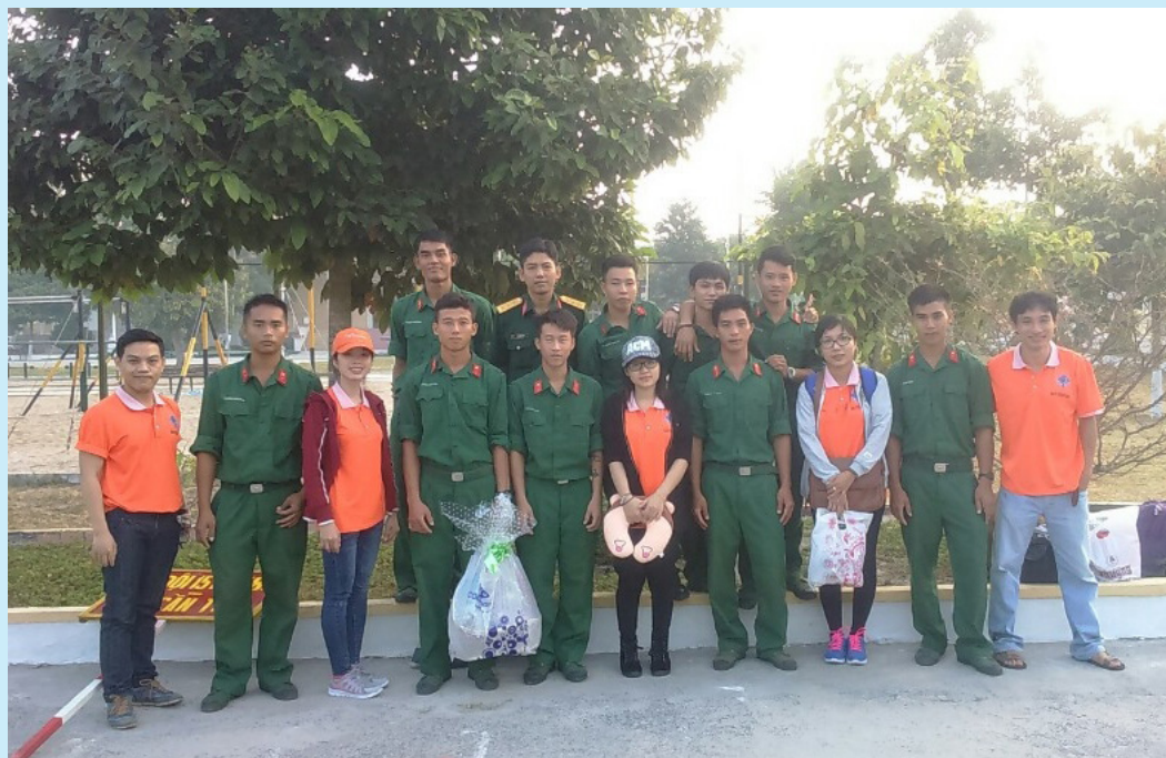
Giao lưu với chủ đề "Tuổi trẻ với mùa xuân biên giới" ở Trung đoàn 1-Sư đoàn 330

Với mong muốn góp phần mang đến một mùa xuân ấm áp, tràn đầy tình yêu thương, Đoàn khối Phòng ban-Trường Đại học Cần Thơ đã tổ chức nhiều hoạt động ý nghĩa chào đón xuân Bình Thân 2016.