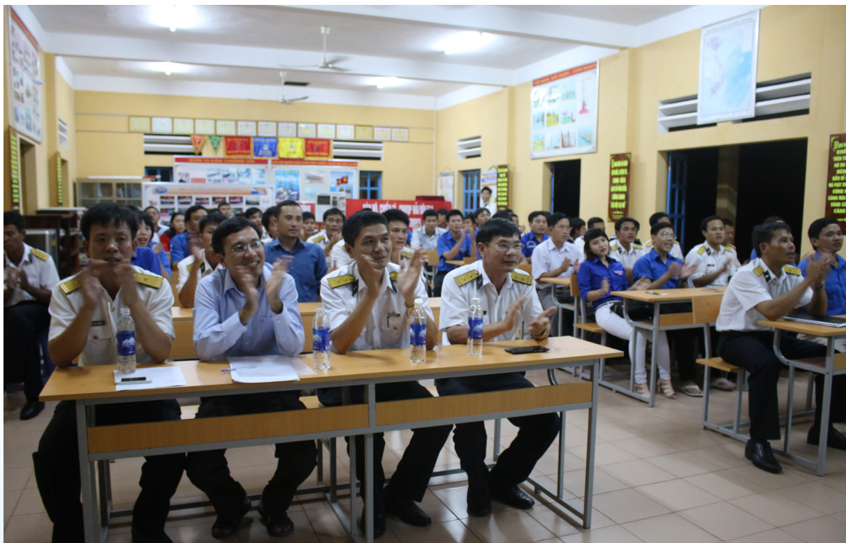
Giao lưu với chiến sĩ Vùng 5 Hải Quân.

đổi thân quen, bình dị. Những ngày tháng trải qua ở đây dù ngắn ngủi nhưng cũng đủ xây đắp trong em cả một trời kỷ niệm. Em nhớ lắm những ánh hồng lúc bình minh, khi tiếng còi cất lên cũng là lúc em dụi mắt ra tựa lan can ngắm các anh tập thể dục, các anh tập đều lắm, đẹp lắm, nhìn rất dũng mãnh. Rồi lúc dùng chung bữa cơm đậm màu biển khơi, chúng ta cùng nhau cười đùa và kể cho nhau nghe những buồn vui của đời mình. Và khi màn đêm buông xuống, trên những con tàu, chúng ta cùng nhìn ngắm chiến lợi phẩm của cuộc thi-những con còng mà chúng ta vừa bắt được. Còn trò chơi lớn, còn ca hát nhảy múa, còn tắm biển, còn nấu nướng chung,... Vui bao nhiêu thì khi chúng ta chia lìa, nỗi buồn lại nhiều bấy nhiêu. Giờ đây, nơi chốn này, trong cái lạnh buốt của những ngày cuối đông, em ước gì có thể nhờ gió với mây gửi đến các anh những chiếc chăn ấm và mềm nhất, những bông hoa tươi thắm nhất và cả những nụ cười thân thương nhất.